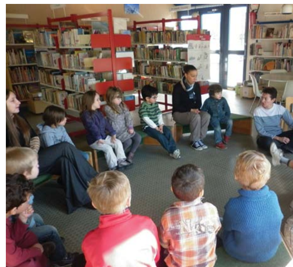
À la bibliothèque pour une matinée contes

Ces œuvres ont fait un gros effet à l'arrivée du défilé carnavalesque au centre culturel