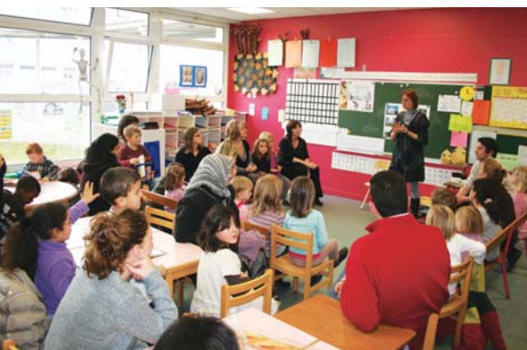
Lors d'un atelier

Avec les parents et les élèves, des expos et des ateliers