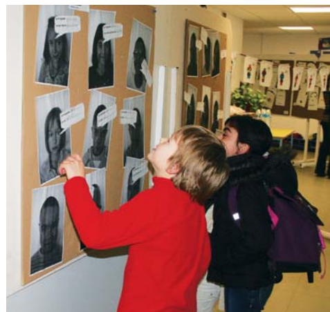
Les enfants intéressés par l'exposition

rappeler, ne saurait résoudre les problèmes liés à la misère dans un monde où certaines marques n'hésitent pas à faire travailler des enfants en âge d'être scolarisés.