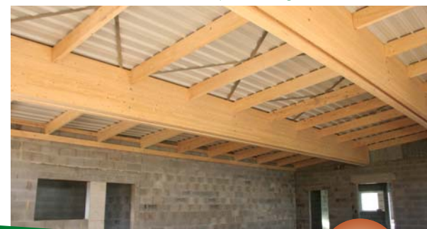
La salle multi-activités en construction dans le respect de l'Agenda 21

Les inscriptions sont encore possibles : contact (Julien Vye au 04 75 57 74 74 ou jvye@ville-portes-les-valence.fr )