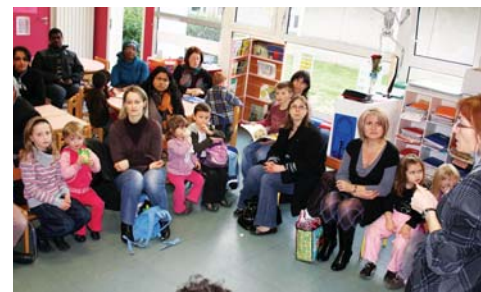
Parents et enfants lors d'un atelier

lisée, il y a encore 120 millions d'enfants qui dorment dans la rue de par le monde. C'est dire qu'une Convention, même si elle a le mérite d'exister et qu'il convient de sans cesse