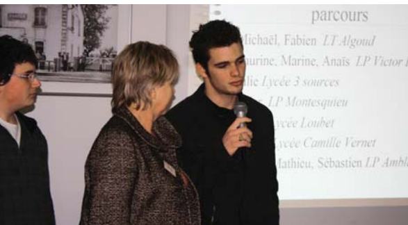
Des jeunes témoignent de leur parcours après la 3 ème

Un buffet dînatoire a clôturé cette journée. Il était confectionné par les élèves de la SEGPA du collège Gérard Gaud et, parmi eux, de jeunes Portoais qui, déjà, avaient assuré le buffet des vœux du maire. Mais, à l'heure où vous lirez ces lignes, ils seront sur un chantier solidaire au Nicaragua que la municipalité a en partie subventionné.