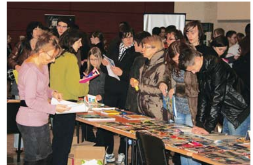
Les parents et leurs enfants se renseignent sur les filières

On a pu dénombrier nettement plus de mille parents et leurs jeunes ados lors de cet après-midi. Ils ont pu rencontrer les représentants des différents lycées et lycées pro-