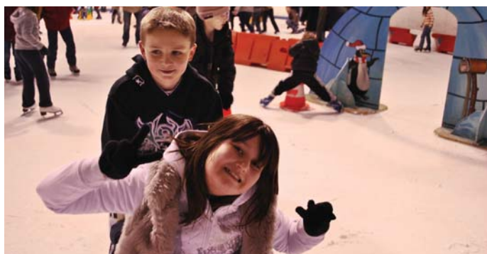
Les joies de la glisse à la patinoire

Etre en vacances, c'est aussi et surtout la possibilité de les vivre pleinement. Pour ce,