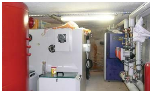
La chaufferie bois

Des animations sont également prévues cette semaine. Elles se poursuivront en avril.