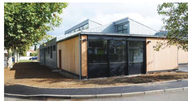
La salle Fernand Léger

Approuvé par délibération au mois de septembre 2010, le plan d'actions de l'Agenda 21